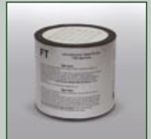
Von dritter Seite geprüft!